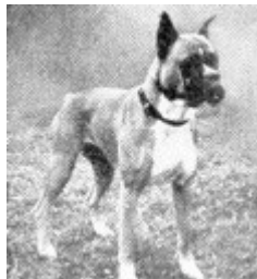
1946 Gro av Kerberos