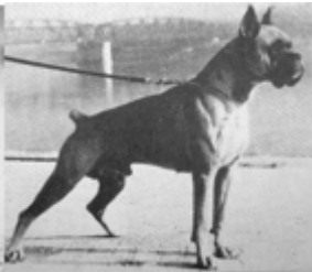
1950 Carlo v Fels