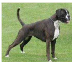
2006 N DK VDH Ch Kvadratens Operah Klara