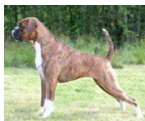
2010 Int ChTeverica's No Apology