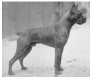
1926 Edler v Isarstrad