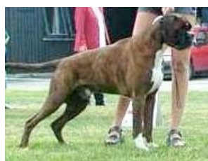
1999 Nord VDH Ch Rogneruds Diesel

Det er det siste tiåret importert flere gode hunder til Norge fra kontinentet, samt at flere oppdrettere har benyttet seg av kontinentale avlshunder til sine tisper. De høyest premierte boxere i dag holder internasjonalt nivå.