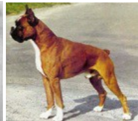
1987 Mirco v Turmblick