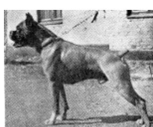
1950 Strandborg Kavalier