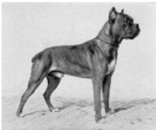
1907 Titus-Vogelsberg v Rennplatz

jakthunder (f eks elghund). Dyktige oppdrettere i Syd-Tyskland, i München-området, la grunnlaget for dagens boxer. Da den 1. verdenskrig brøt ut ble boxeren anerkjent som tjenestehund og ble brukt under krigen som krigshund til forskjellige oppgaver. Man la allerede den gang stor vekt på at hunden var "schneidig, temperamentsvoll und mit grossem Kampftrieb".