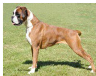
2011 Int Ch Cavajes