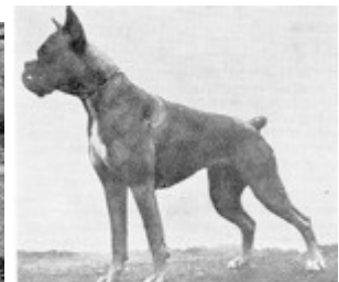
1950 Ch Duchess

På slutten av 30-årene hadde Norge en meget høy standard på rasen, men krigen satte en stopper for dette. Etter krigen var nivået sunket drastisk, og