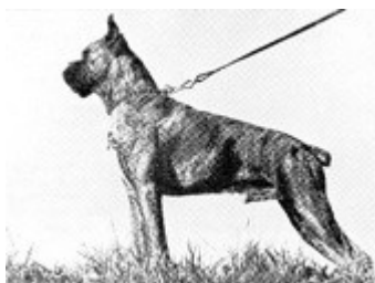
1939 Karol v Dom

Interesserte boxerentusiaster importerte de første tiårene mange gode boxere fra Tyskland, disse dannet grunnlaget for den videre avlen som høynet nivået på rasen.